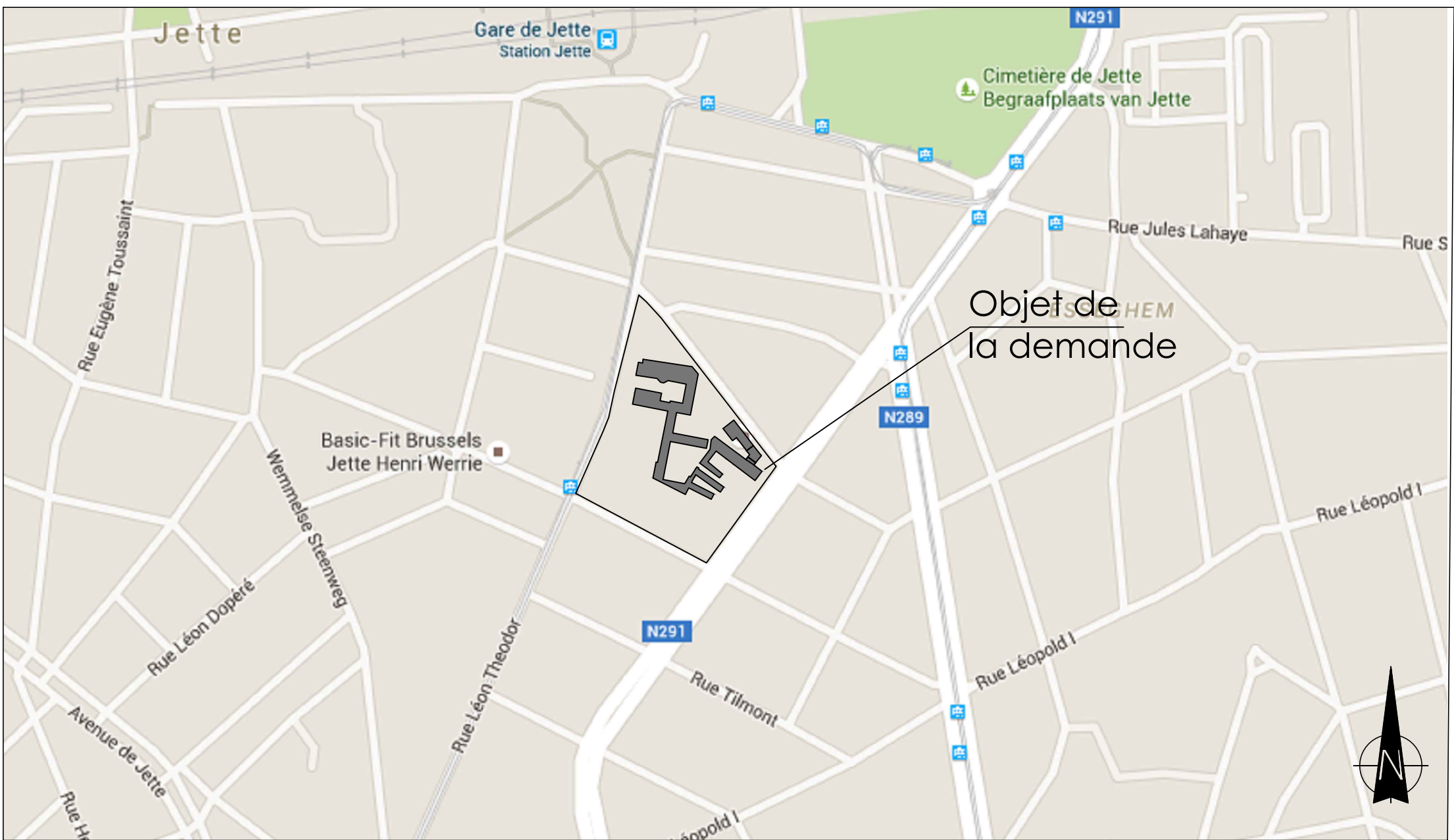
Plan de localisation - 1/5000

Commune : JETTE Rue Jean-Baptiste Verbeyst 25 1090 BRUXELLES