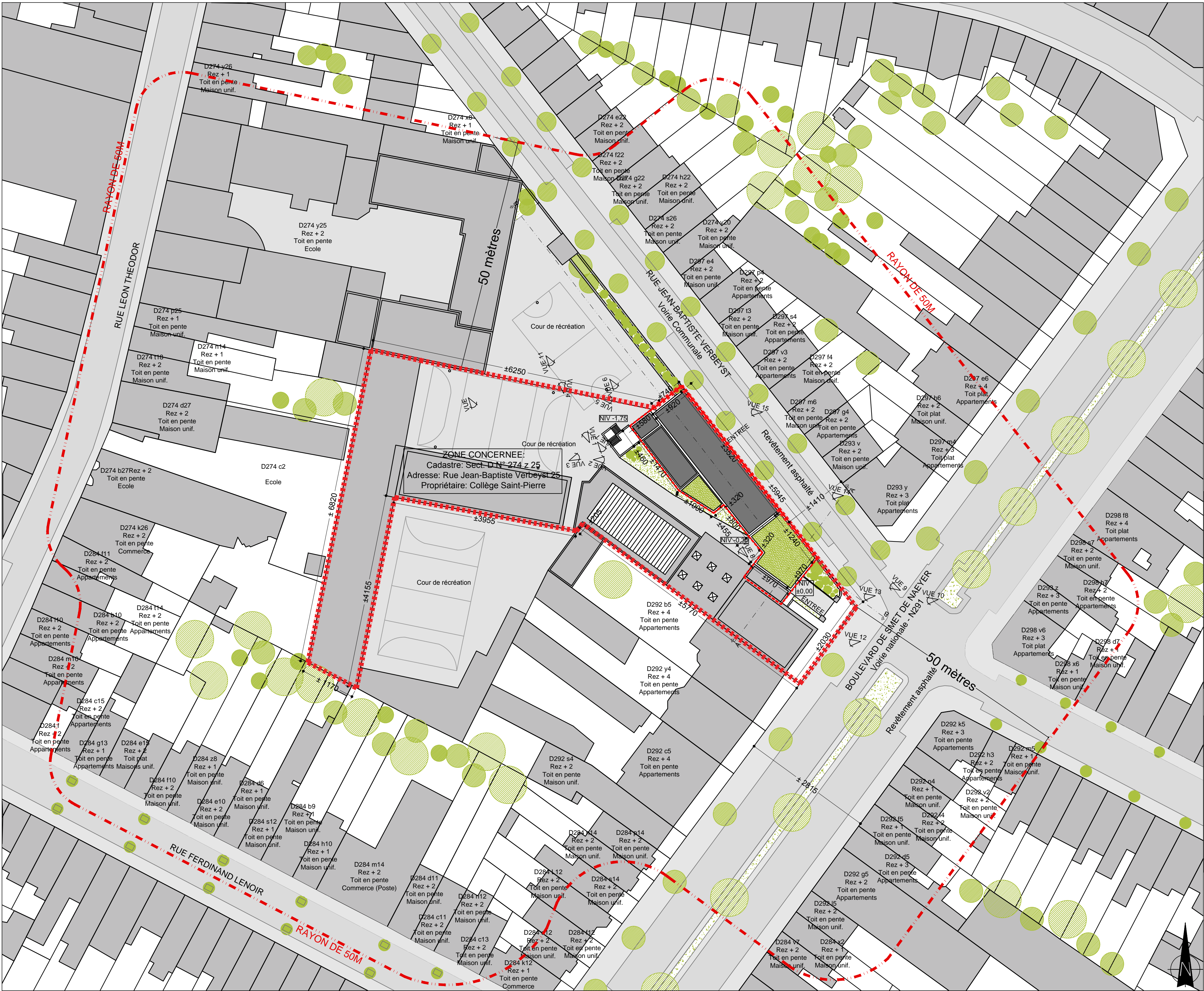
Plan d'implantation générale - 1/500